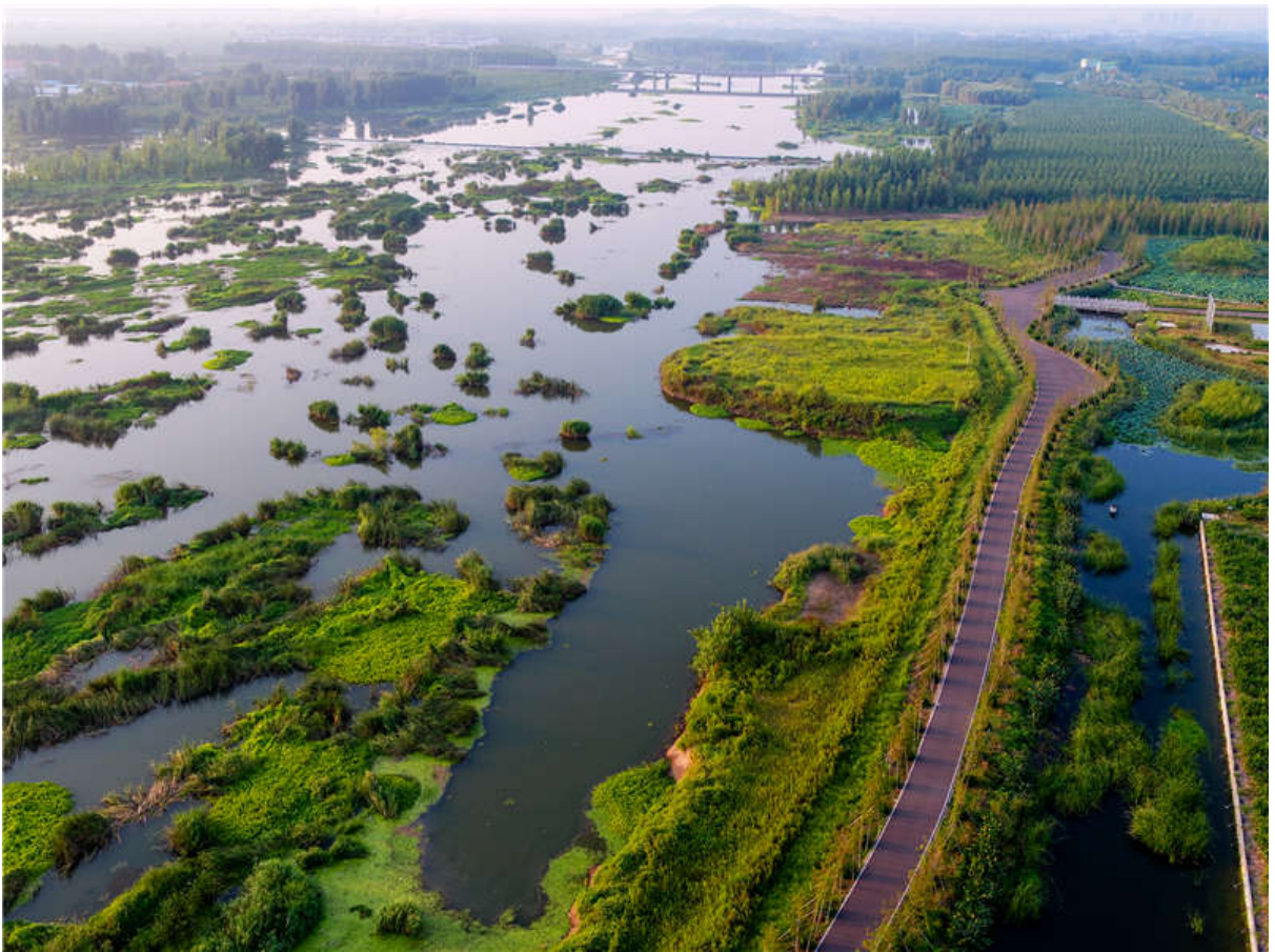
山东沂水国家湿地

同时，《临沂市湿地保护办法》为湿地保护划定了红线。办法第12条规定，“编制湿地保护规划，应当根据湿地资源分布、类型及特点、保护范围、生态功能和